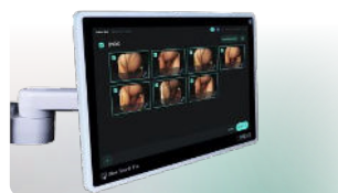
Trasferimento automatico o selettivo