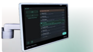
Recupero della Worklist DICOM dal SIO