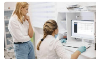
Amministrazione centrale direttamente dall'ufficio IT

Fissa un appuntamento. Siamo lieti di consigliarti.