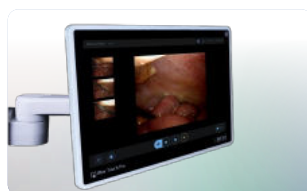
Acquisizione di immagini e video di qualsiasi durata